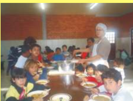
Estávamos com saudades. Que sopinha deliciosa.

Voluntárias descansadas e com muita vontade de trabalhar já estão na luta. Fizemos uma parceria com o Senac trazendo um curso de vendas e algumas alunas de Secretariado Executivo da Unicentro estão pondo em ordem nossa secretaria.