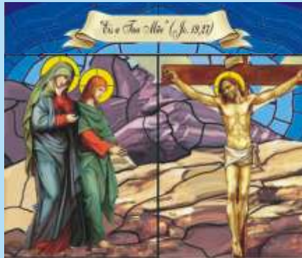
Jesus Crucificado. Amor Maior não há.

Hão de olhar para aquele que trespassaram ( Jo 19,37)