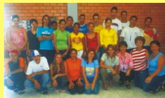
Parceria com o Senac para formação dos jovens no Curso de Vendas.

Coordenação do Projeto "Paixão Pela Vida".