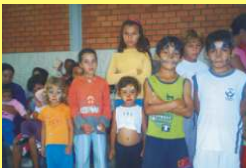
Logo teremos mais uma páscoa para eles.

A euforia das novenas de natal passou. Foi muito produtivo e emocionante conseguirmos, mais uma vez, cumprir nossa meta de 500 cestas. Uma arrecadação e uma mobilização de encher os olhos. Mas com certeza elas já acabaram e a fome volta a rondar aquelas famílias. Nós brasileiros gostamos de novidades e grandes agitos e quando chega o comum e a rotina volta, vamos nos apagando e nos esquecendo dos acontecimentos vibrantes. O cotidiano voltou e as coisas retomam o seu caminho. Nesse tempo de recolhimento e meditação, conversão e penitência devemos destinar um pouco do nosso tempo à meditação das mazelas do mundo, das tristezas e desentendimentos, da violência contra a família e lutarmos por um mundo melhor. Entretanto estamos de prontidão para que isso não aconteça. O Recanto da Paz da Alegria e da Esperança já está funcionando a todo vapor.