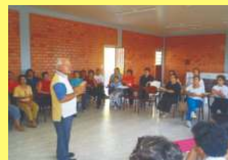
As reuniões também voltarão e serão frutíferas como sempre.