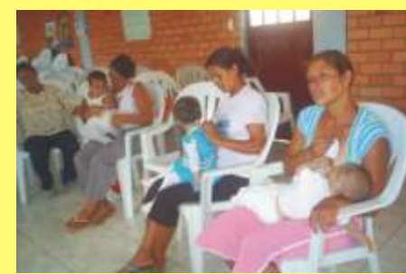
Os grupos também estão retornando e com ele às crianças para o peso mensal.