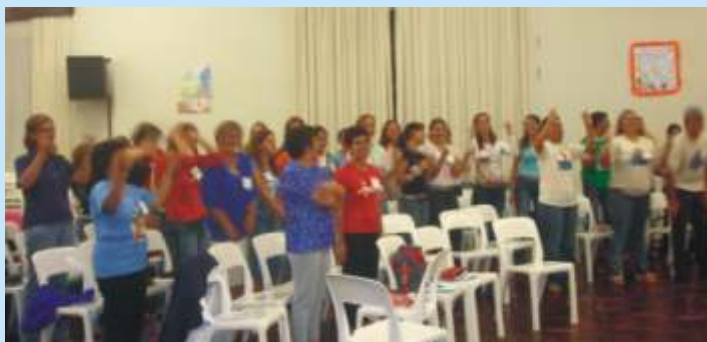
Catequistas em formação para melhor repassar o ensinamento de Jesus.