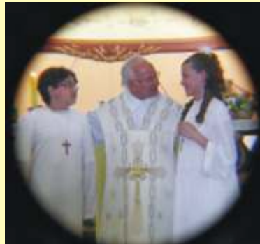
O Carinho do pastor é retribuído pela comunidade em oração constante pela recuperação de sua saúde.

E nós estamos completamente envolvidos com a obrigação de promover a paz, o amor e, portanto a igualdade entre as pessoas. Só assumindo a nossa parte, estaremos construindo um mundo melhor.