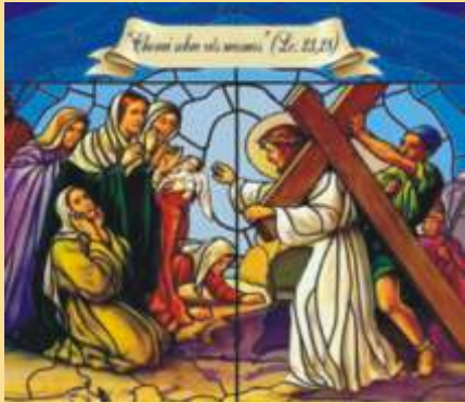
Quaresma, período de conversão e arrependimento de nossos pecados perante o Senhor, que com seu amor incondicional nos perdoa.

Eis o tempo de conversão. Um tempo favorável para o nosso crescimento espiritual, com convites insistentes para "nos convertermos e crermos no Evangelho". A palavra Quaresma vem da palavra "quarenta", um número muito presente na experiência de vida do povo de Deus, como por exemplo, os quarenta dias do dilúvio (Gn 8,6), os quarenta dias de Moisés no Monte Sinai (Dt 9,9), os quarenta dias do profeta Elias a caminho do Monte Horeb (1Rs 19,8), os quarenta dias do profeta