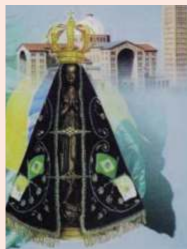
Nossa Senhora da conceição Aparecida, Padroeira do Brasil.