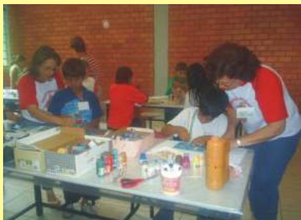
Curso de pintura para adolescentes. Quem sabe não surge um novo Picasso?