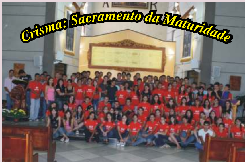
Encontro de Formação dos Crismandos de 2007