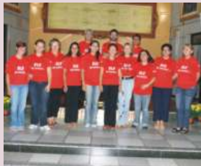
Catequistas do Crisma da Paróquia Santa Cruz.