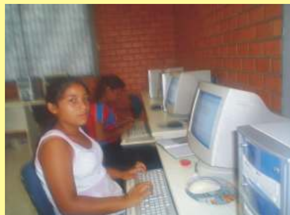
Novas turmas de informática em 2007. É o resgate pela inclusão digital.