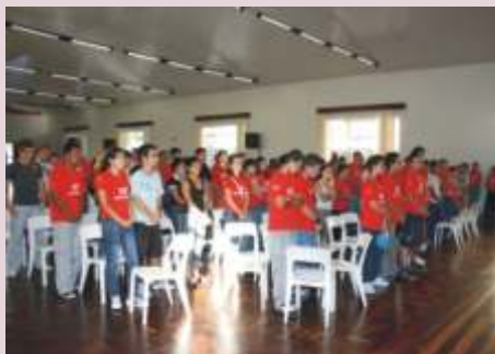
Envia teu Espírito Senhor e Renova a Face da Terra.