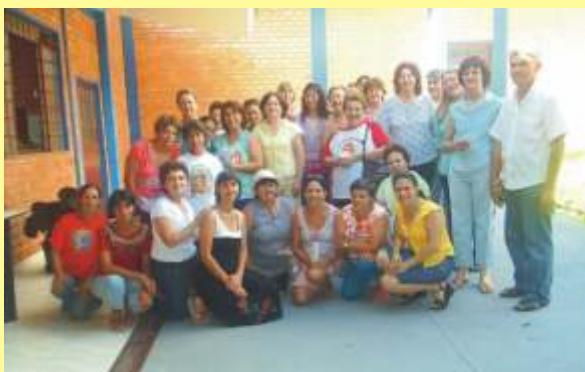
Alunas do Curso Superior de Tecnologia em Secretariado Executivo da Faculdade de Tecnologia Internacional, FATEC, em estágio no Projeto, contribuindo com as voluntárias.