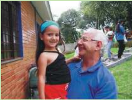
Das crianças é o reino dos céus.