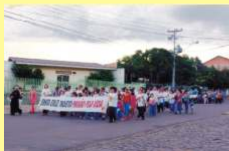
Guiados pelo amor: "Eu vi uma luz".