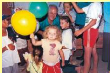
Continentes de esperança e de amor.