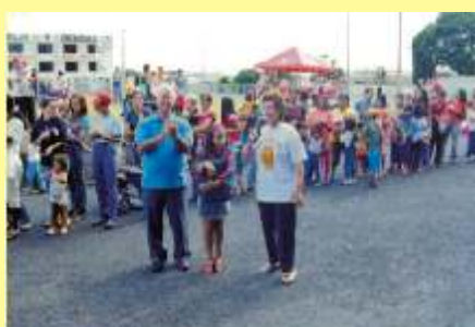
A boa nova da dignidade humana.