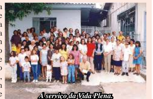
A serviço da Vida Plena.

Qual é a força que move essas pessoas a agirem assim? Nada mais nada menos que a "FORÇA do AMOR doação". Se você apenas conhece, tenha um momento de coragem. Essa coragem chama-se "DOAÇÃO". O que está faltando para que nos doemos um pouquinho ao PAIXÃO PELA VIDA? Eis algumas atividades desenvolvidas nesse projeto: sopa enriquecida, grupo de auxílio as gestantes e adolescentes, domingo da solidariedade, alfabetização de adultos, farmácia e fitoterapia, atendimento à crianças de baixo peso, aulas de informática, brinquedoteca, dia da criança, Páscoa e Natal, quem sabe você se afeiçoa com uma delas e vem nos ajudar?