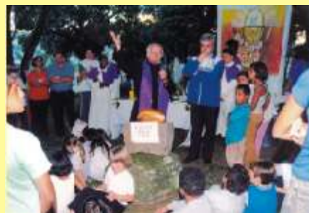
Uma pedra e um pão: ação de graça a Deus.