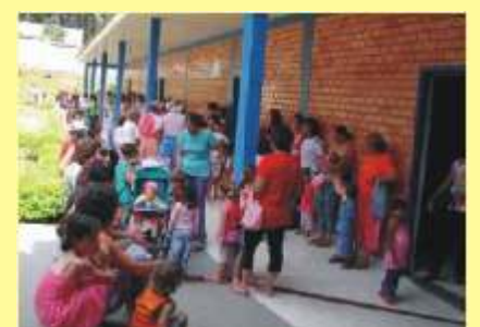
A família cresce.