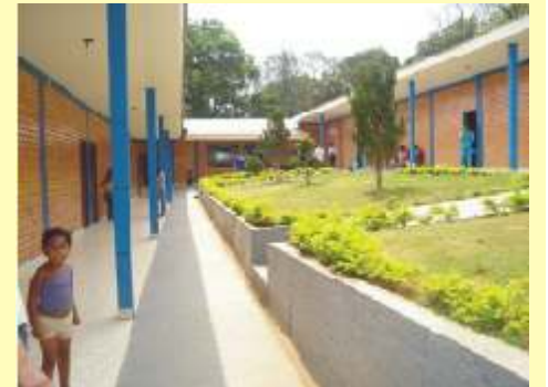
Recanto da Paz, da Alegria e da Esperança: conheça-o pelo site: www.paixaopelavida.com.br

Nossas líderes são incansáveis e demonstram a grande inquietude da paróquia com relação às suas crianças carentes. Como dormir se o irmão não dorme? Como comer se o irmão não come? Até quando sorrir se o irmão está chorando? Como celebrar a vida se ao meu lado existe a morte? Foi buscando respostas que esse trabalho iniciou. A única condição para exercer esse serviço voluntário é o AMOR. Amor incondicional, gratuito, simples, puro, desinteressado, humilde, frágil e