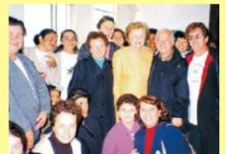
Acreditar na vida e nunca desistir dela.