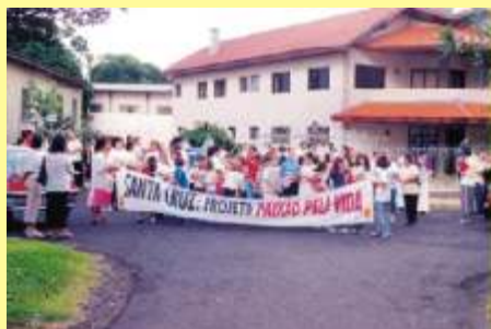
A realidade que nos desafia.