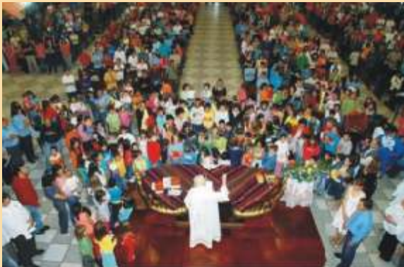
As crianças a tarefa de levar ao mundo o anúncio do Natal.

Deus lhe escolheu para contar para os outros do Seu Grande Amor. Amor que consegue ultrapassar limites e barreiras e alcançar a tantas pessoas que vivem sem luz, sem paz, sem fé, sem pão.