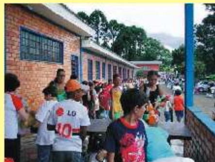
Momentos para guardar com carinho na lembrança.