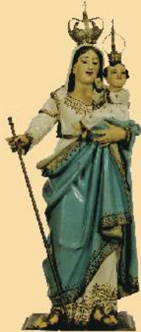
Nossa Senhora de Belém, rogai por nós.

Confiança e certeza que Ela, a Mãe, iria fazer História na história deste povo, em seus eventos e desafios pelas gerações afora. Enquanto a nossa gente se reencontra no nome da Mãe, respirando aquele ar que mais a identifica, no respeito de sua história e tradições, nos é doce unir a nossa humilde voz àquela que há decênios se eleva e se expande por toda parte... Profundamente sempre me toca, e se torna estilo único para todo leitor crente e divulgador da Palavra Viva e Ortodoxa do Evangelho, a conotação do próprio João em seu relato: " Eis a tua Mãe. E João a levou para sua casa ".