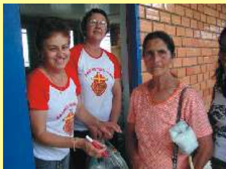
Alegria por ser mãos estendidas.