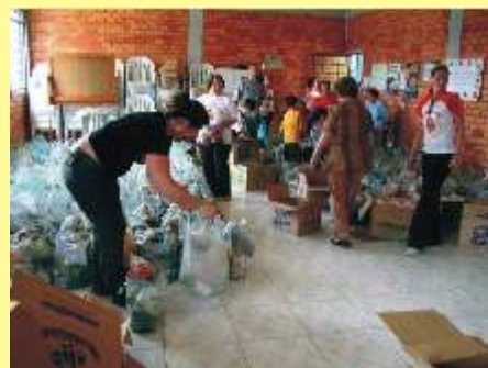
É hora de partilhar.