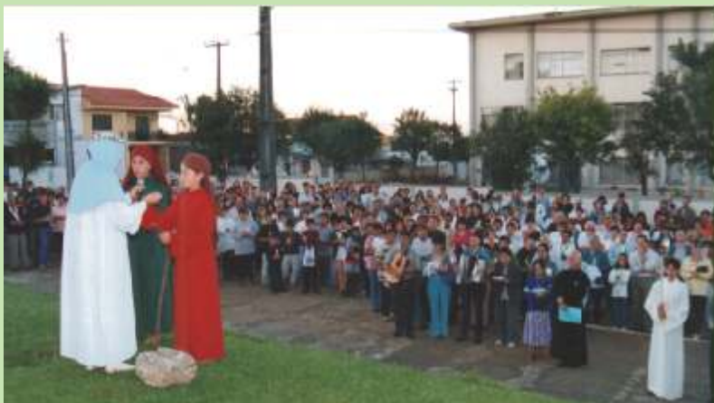
Nossa Senhora da Salette dá a mensagem aos adolescentes Maximiliano e Melânia. (Encenação no dia da Inauguração da Capela enriquecida pela "água para todos").