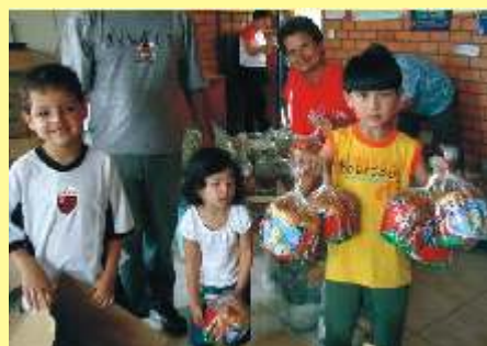
Crianças e adultos uma só família.