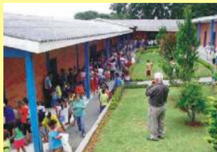
Recanto da Paz, da Alegria e da Esperança.