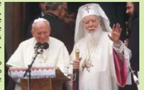
Papa João Paulo II com o Patriarca Teoctist I.