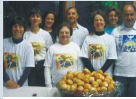
Equipe do dízimo.

O Povo de Deus espera um Salvador em seu cavalo alado, forte, com exércitos ao seu mando, mas Ele veio através de uma mulher, Deus quis precisar de Maria, uma mulher, menina, frágil, para que Nela e por meio Dela tivéssemos o Senhor Jesus, nosso único Salvador.