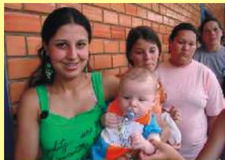
Ah! Se todo dia fosse Natal!