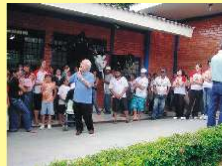
Amigos doadores: Deus os abençõe.