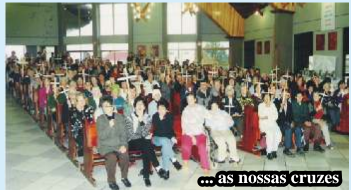
... as nossas cruzes