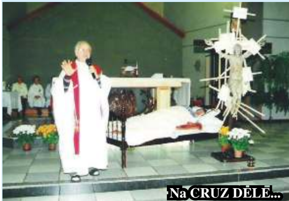
Na CRUZ DELE...

Vamos abrir a janela da fraternidade desde o primeiro dia deste novo ano, acolhendo com especial carinho aqueles irmãos e irmãs que a sociedade discrimina como "deficientes", "limitados por handicap", "retardados", etc. mesmo quando os identifica como "excepcionais" e "especiais".