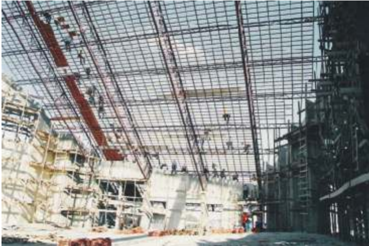
Da Igreja de Santa Cruz se enxerga um Céu mais bonito.