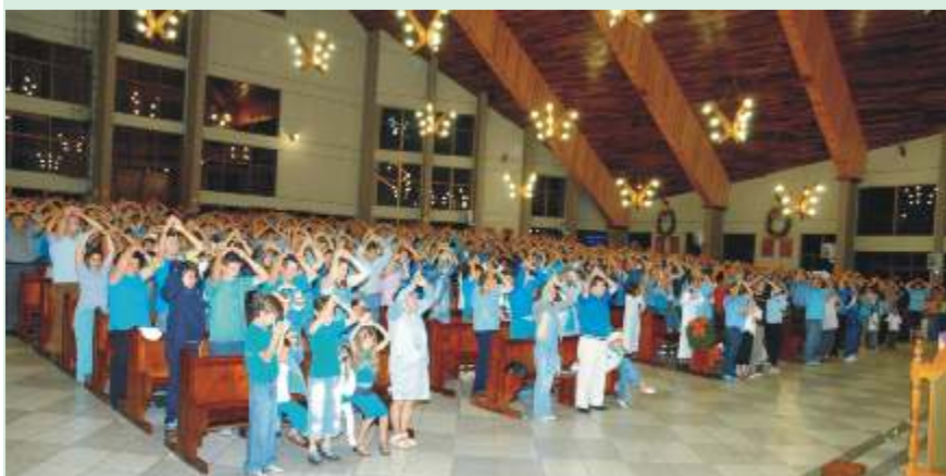
Momento sugestivo da conclusão da Novena de Natal, na Igreja de Santa Cruz: Nós próprios queremos ser tenda para o Nascimento de Jesus.

As Novenas de Natal na Paróquia de Santa Cruz tornaram-se não apenas uma tradição para preservar , mas fonte de evangelização confiada à inteira Comunidade.