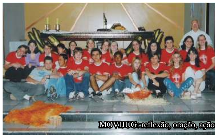
MOVIJUG: reflexão, oração, ação

Fica aberto o convite a todos os interessados em fazer parte desta família. Os encontros acontecem aos sábados, às 19h30min. no Centro Catequético da Paróquia.