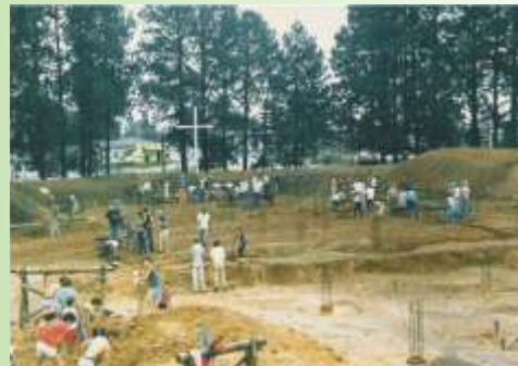
"Os que semeiam entre lágrimas

Santa Cruz Ontem: trabalhando Hoje: celebrando Sempre em mutirão