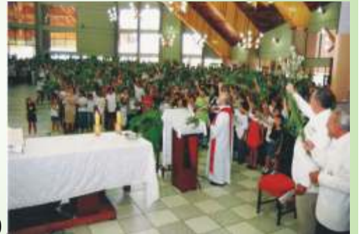
recolherão com alegria" (Sl 126,5)

Santa Cruz Ontem: trabalhando Hoje: celebrando Sempre em mutirão