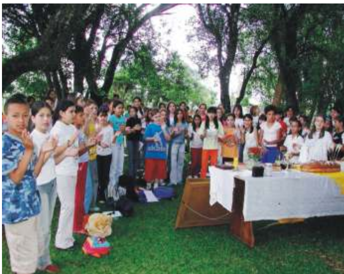
Primeira Santa Missa rezada no Recanto