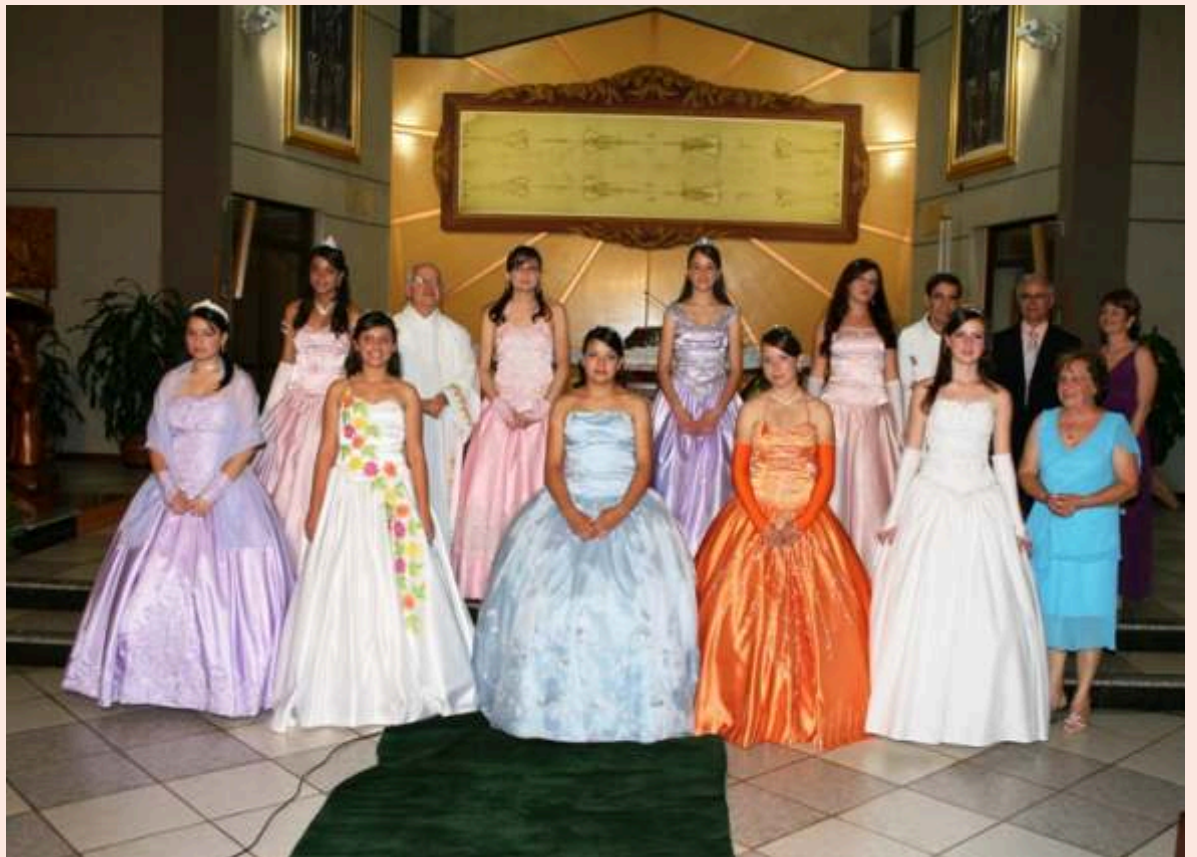
Debutantes para uma vida de perene gratidão.