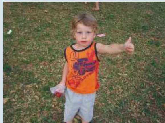
Vamos juntos brindar à vida