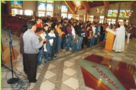
A Família cresce e a Esperança também