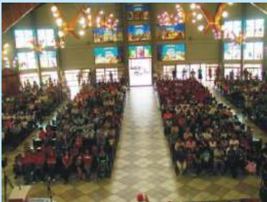
Dia mundial das missões: uma história para a vida.