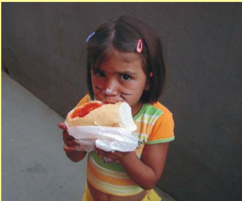
Ah! Se eu tivesse um pedaço de pão cada dia!!!....