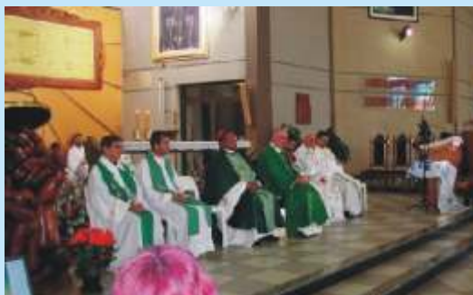
Dia mundial das missões: Um dia para a história.