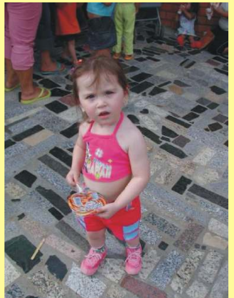
O que você achou da minha festa?