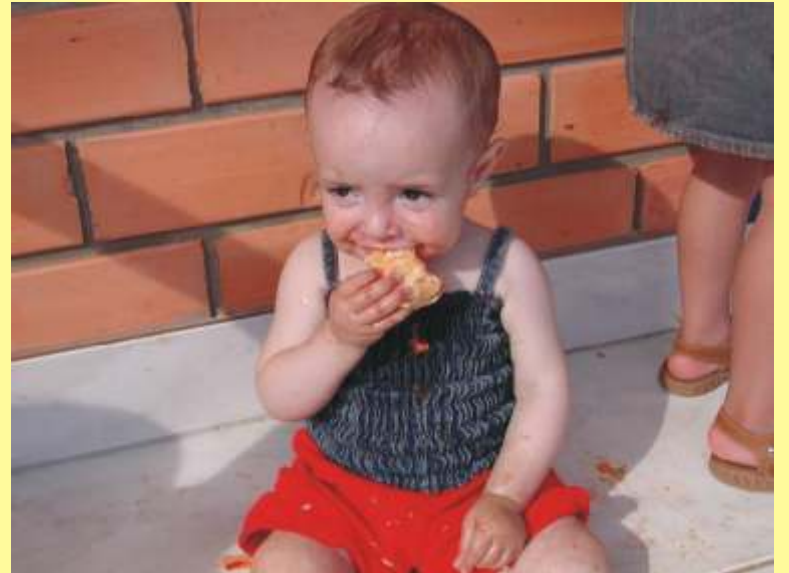
Com gosto e confiança.