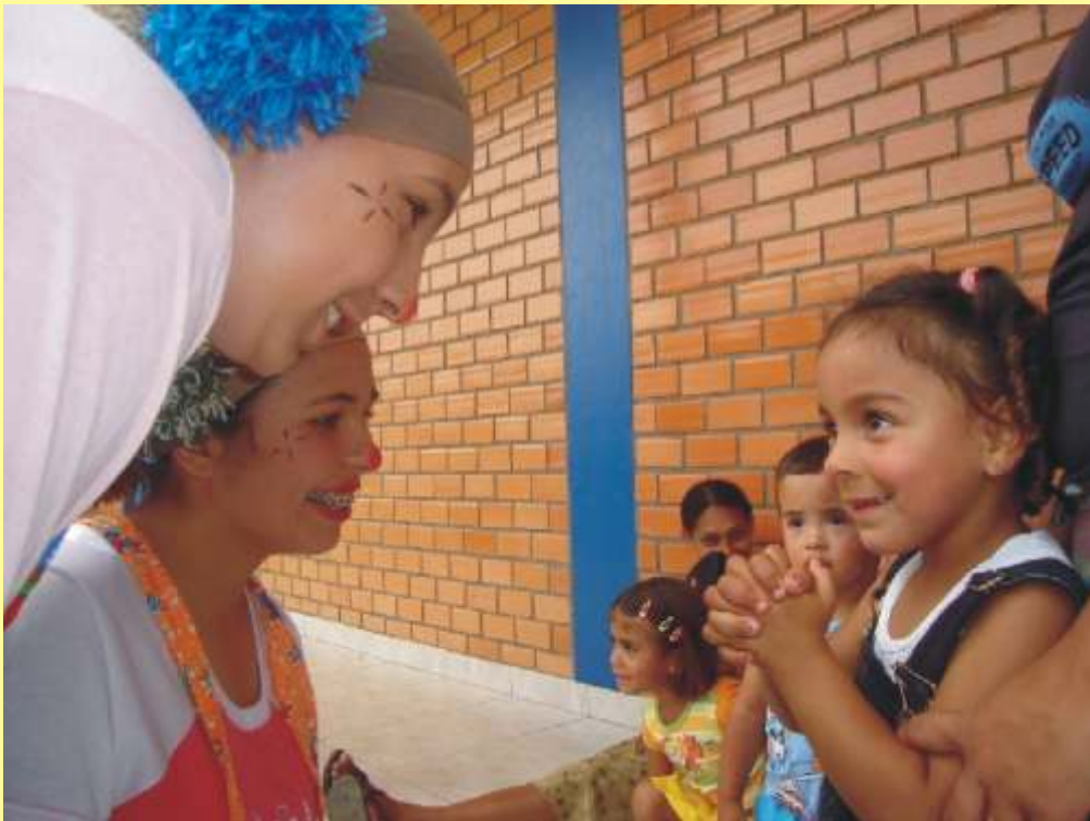
Quem faz feliz uma criança acende uma estrela no Céu.