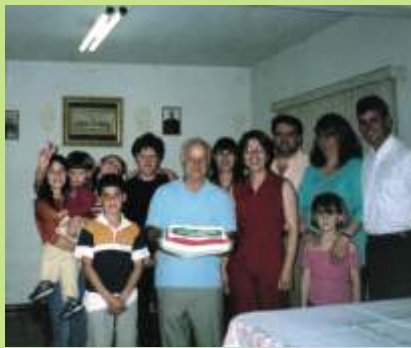
Amigo é o maestro de uma orquestra.