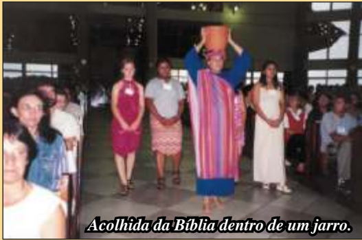
Acolhida da Bíblia dentro de um jarro.

Abrir este livro sacro é como abrir a porta que introduz diretamente à sabedoria e ao conhecimento de Deus. Quando nos deixamos invadir pela palavra contida neste livro, Deus se faz próximo, anda e respira conosco, palpita em nosso coração. E sua presença amplia nossos horizontes, dá sentido e valor a todos os nossos passos.