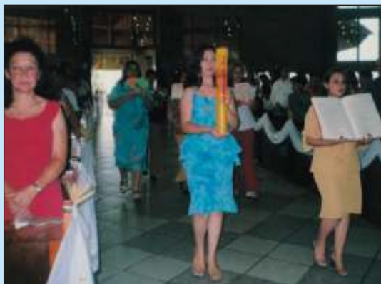
"Pela palavra de Deus saberemos por onde andar..."