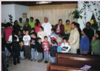
É na família que a paz se consolida.