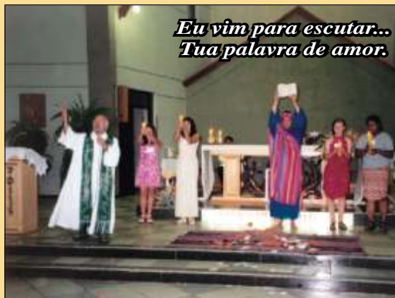
Eu vim para escutar... Tua palavra de amor.

A palavra de Deus é, portanto uma água benéfica que molha e, onde quer que passe, faz desabrochar uma vida nova.