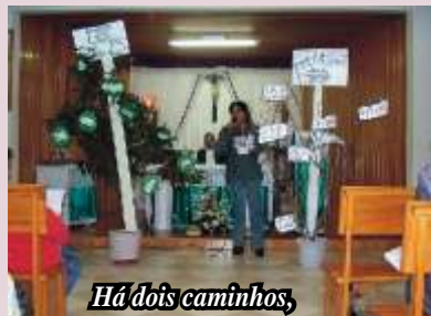
Há dois caminhos,