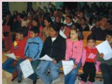
Deixa vir a mim as criancinhas.