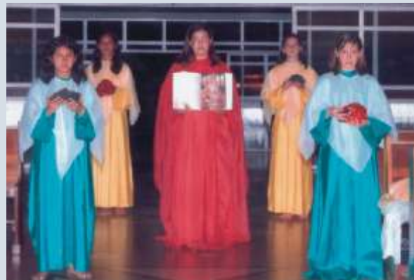
Dá-me a palavra certa, na hora certa e do jeito certo.