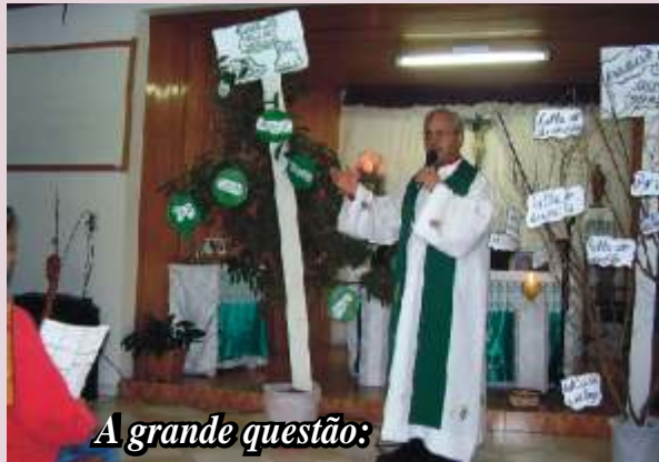
A grande questão: